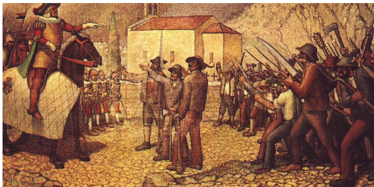
Srečanje grofa Coroninija s puntarji pri Solkanu 27. marca 1713. (Tone Kralj, olje na platnu, 1972, hrani Tolminski muzej.)

(Digitaliziral Luka Rudman, dijak Ekonomeks šole Novo mesto.)