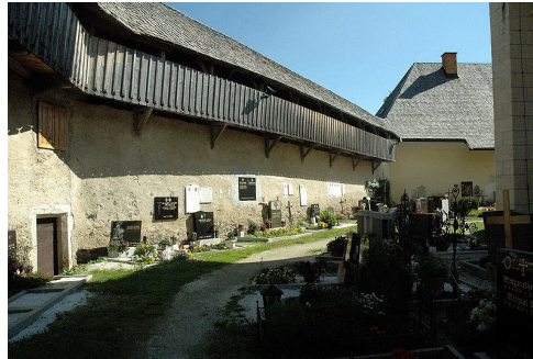
( http://sl.wikipedia.org/wiki/Slika:Diex_Wehrkirche_02.jpg (dostop: 8. 9. 2012).)